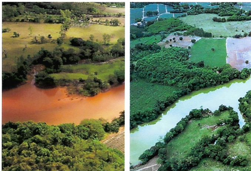
Figura 1: Río Margajita en 2012 (izquierda) y ahora (derecha)

Debido al trabajo de remediación que Pueblo Viejo ha estado realizando desde el 2012, las aguas de la represa Hatillo cumplen con los estándares de calidad de agua dominicanos aplicables. Esta extensa campaña de remediación ha sido muy exitosa. Para dar solo un ejemplo, la calidad del agua ha mejorado al punto que la Asociación de Productores de Pescado de Hatillo pudo establecer un programa de crianza de peces (especialmente tilapia y trucha), que produce alrededor de 50 toneladas de pescado por año, generando ingresos significativos. y oportunidades de empleo en la zona.