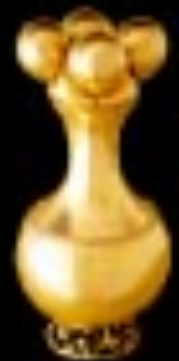
Museo del Oro