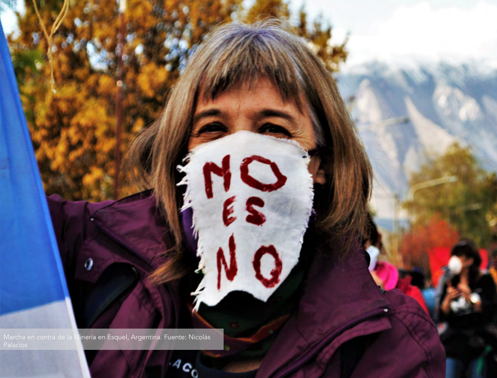
Marcha en contra de la Minería en Esquel, Argentina.

D. LAS EMPRESAS MINERAS Y LOS GOBIERNOS ESTÁN APROVECHANDO LA CRISIS PARA LOGRAR ESTABLECER NUEVAS NORMATIVAS QUE FAVOREZCAN A LA INDUSTRIA A EXPENSAS DE LA GENTE Y DEL PLANETA