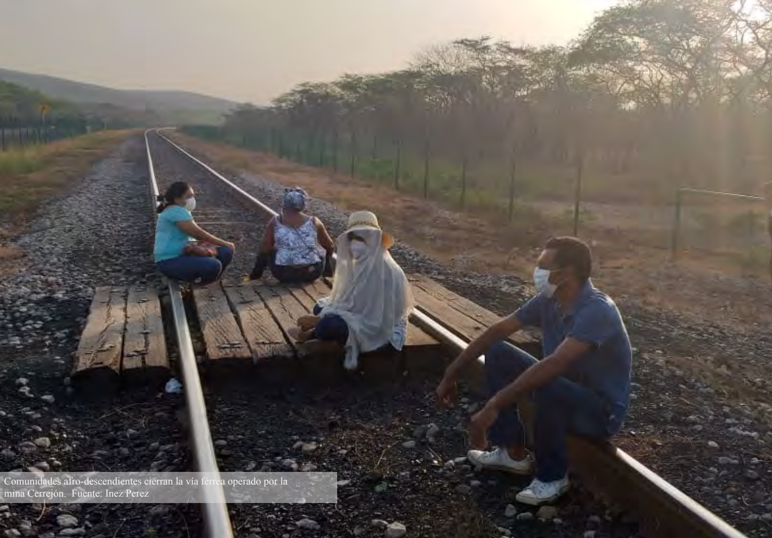
Comunidades afro-descendientes cierran la vía férrea operado por la mina Cerrejón.

“Durante el COVID, Cerrejón ha sido una empresa verdaderamente irresponsable con respecto a la salud aquí, dentro del territorio. Está claro que los Wayuu son algunos de los expuestos y estamos en alto riesgo debido a la línea de ferrocarril que cruza 140 kilómetros de nuestro territorio. La gente está llegando desde afuera sin ningún control. ¿Qué garantías tenemos de que esta gente que está llegando a Puerto Bolívar, donde llegan los cargueros a recoger el carbón de todos los rincones del mundo, no va a transmitir el COVID-19? El tren, lleno de carbón, está pasando las 24 horas del día. La contaminación sigue matándonos y la irresponsabilidad de la empresa también. Y a todos los que nos quejamos, que hablamos, nos amenazan inmediatamente para que dejemos de condenar sus acciones. Lo peor de todo es que el gobierno es un gobierno de rodillas frente a la empresa.”