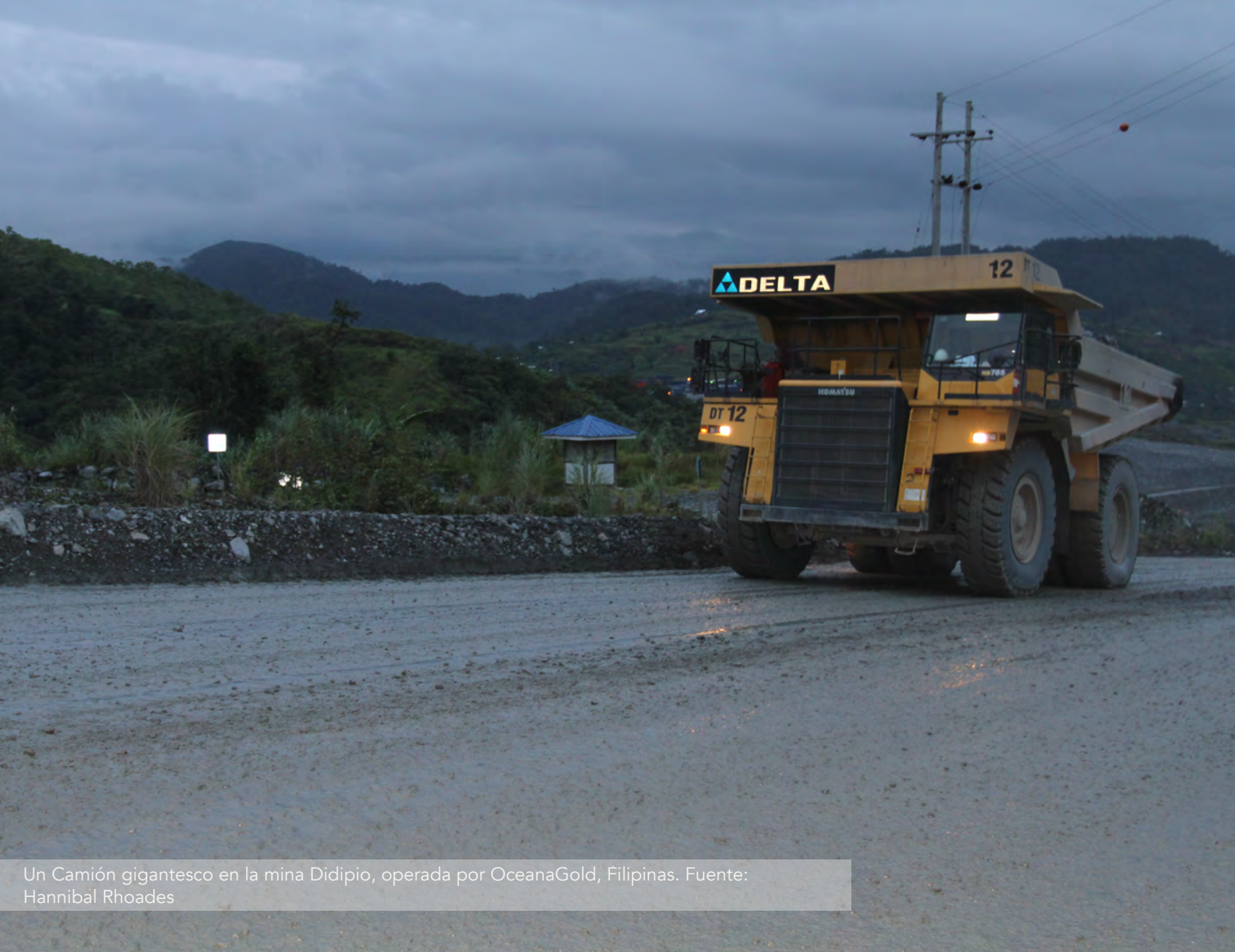
Un Camión gigantesco en la mina Didipio, operada por OceanaGold, Filipinas.

A. LAS EMPRESAS MINERAS ESTÁN IGNORANDO LA AMENAZA REAL DE LA PANDEMIA CONTINÚAN SUS OPERACIONES, USANDO PARA ELLO CUALQUIER MEDIO DISPONIBLE.