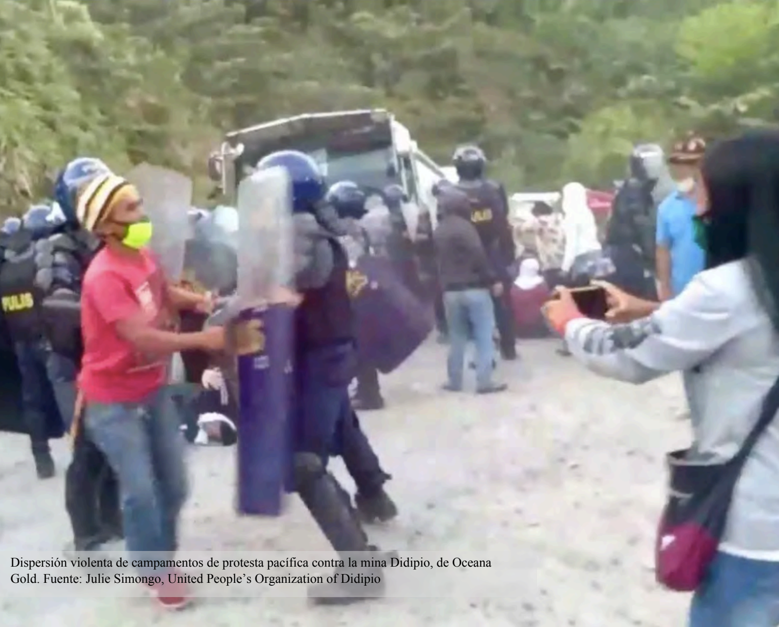
Dispersión violenta de campamentos de protesta pacífica contra la mina Didipio, de Oceana Gold.

B. LOS GOBIERNOS DE TODO EL MUNDO ESTÁN ADOPTANDO MEDIDAS EXTRAORDINARIAS PARA PONER FIN A LAS LEGITIMAS PROTESTAS AFIANZAR EL SECTOR MINERO