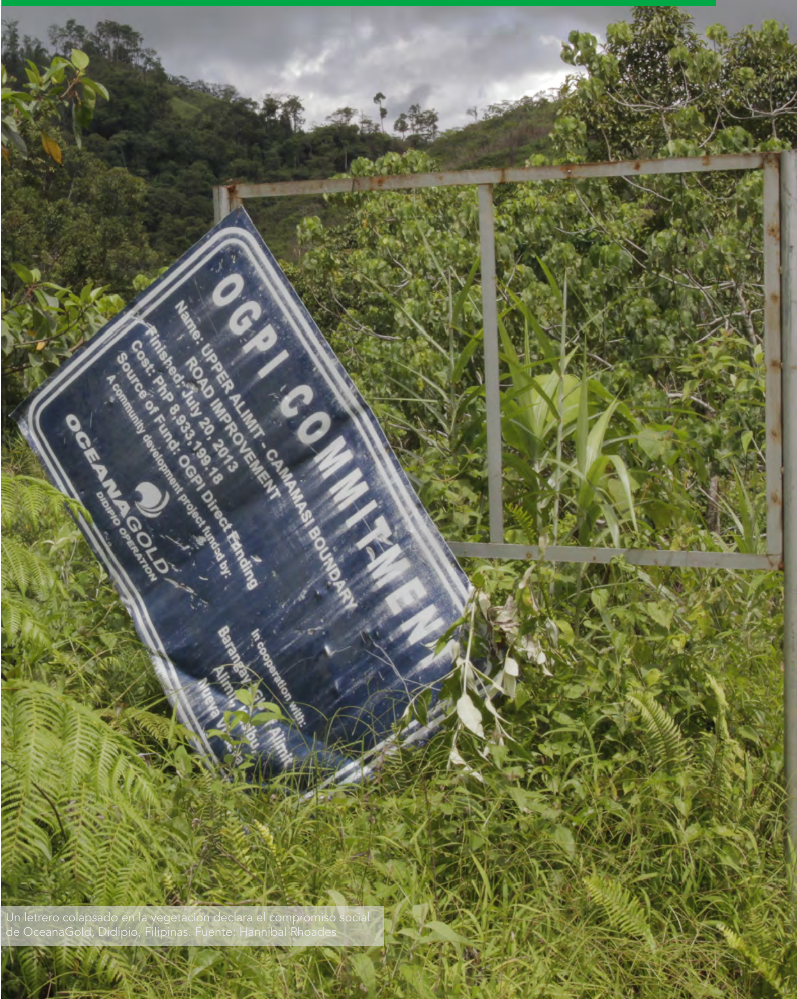
Un letrero colapsado en la vegetación declara el compromiso social de OceanaGold, Didipio, Filipinas.