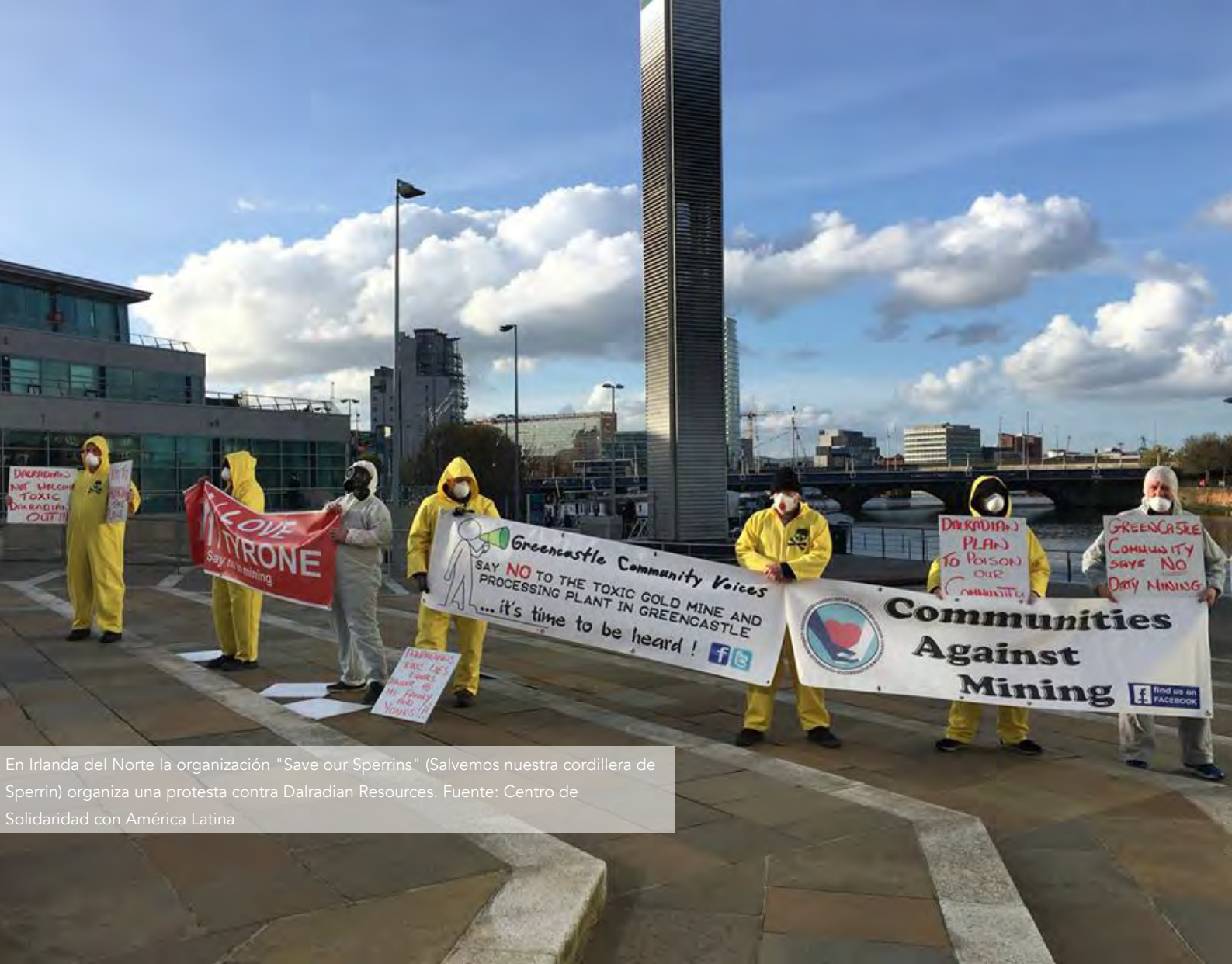
En Irlanda del Norte la organización "Save our Sperrins" (Salvemos nuestra cordillera de Sperrin) organiza una protesta contra Dalradian Resources.